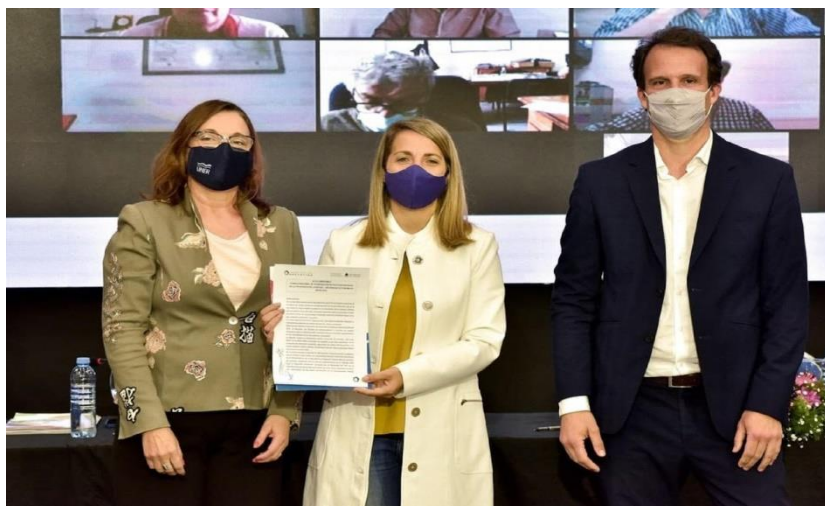
Foto: Firma del Convenio de trabajo entre la Vicegobernación de la Provincia de Entre Ríos (punto focal) con la Universidad Nacional de Entre Ríos.