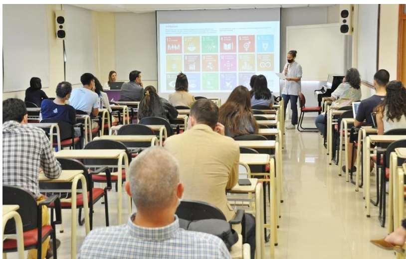
Foto: Capacitación sobre Agenda 2030 y ODS, para estudiantes y docentes de la Universidad Adventista del Plata. Libertador General San Martín. Entre Ríos