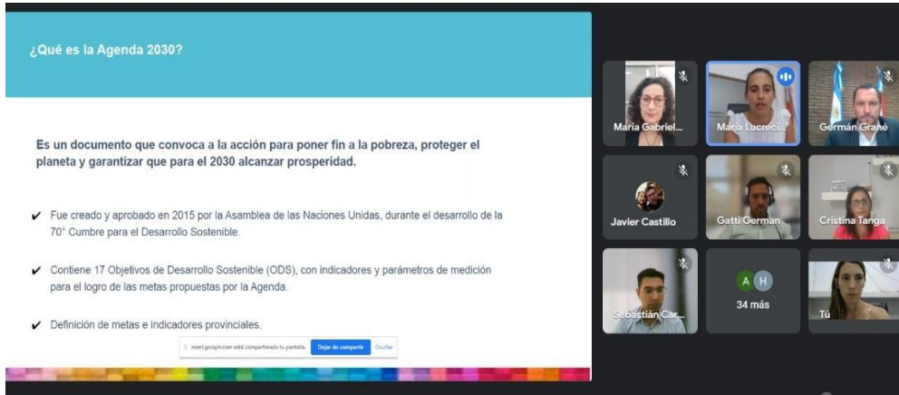
Foto: Reunión de trabajo (vía remota) con referentes de la Agencia Tributaria de Entre Ríos (ATER) sobre Agenda 2030