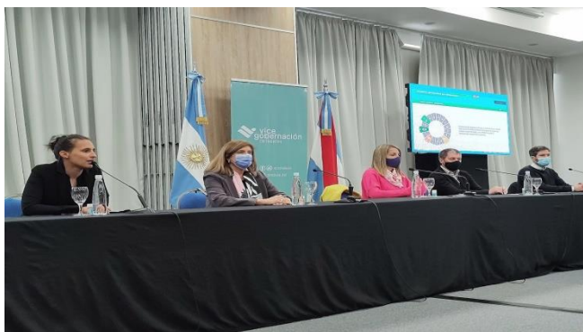
Foto: reunión de presentación de los ODS en la provincia. En la imagen, la Vicegobernadora de la provincia, acompañada por los ministros de Economía, de Gobierno, del Consejo General de Educación y de la Secretaria de Modernización de Entre Ríos.

Articulación Interinstitucional: se generan acciones de coordinación con universidades, organismos públicos y organizaciones de la sociedad civil, destinadas a la sensibilización y ejecución de los ODS en territorio.