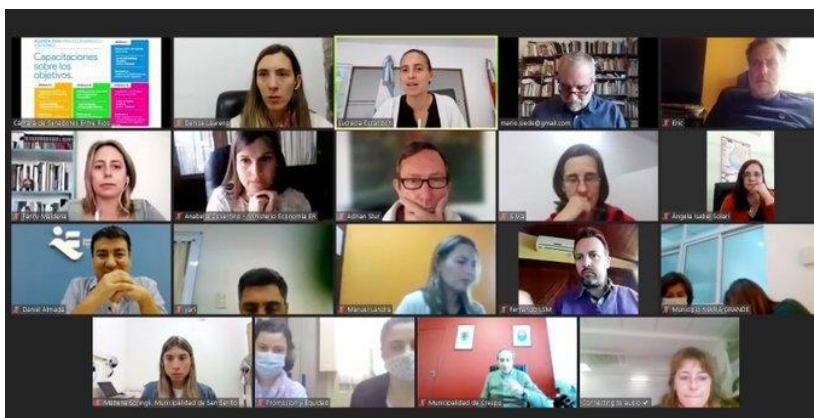
Foto: II Encuentro de capacitación para Municipios en Agenda 2030. Octubre 2021